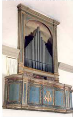
organo, Chiesa di S. Michele Arcangelo, Roncole Verdi