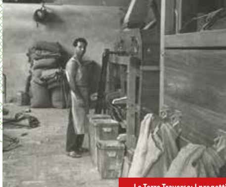
Le Terre Traverse: I progetti