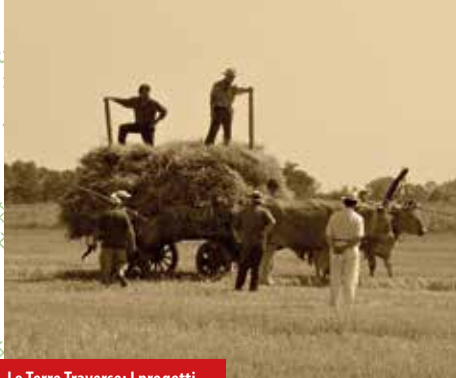
Le Terre Traverse: I progetti