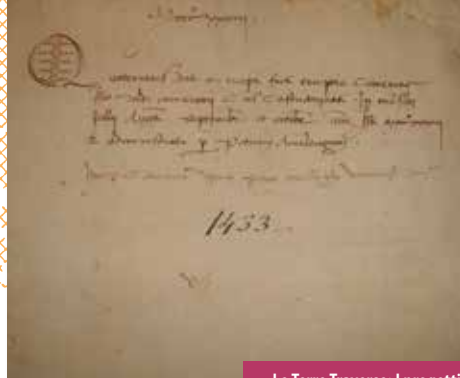
Le Terre Traversate: I progetti